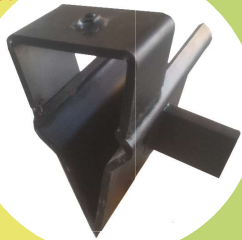
CUNEO A CROCE