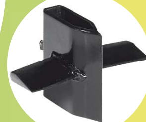
CUNEO A CROCE