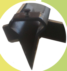
CUNEO A CROCE