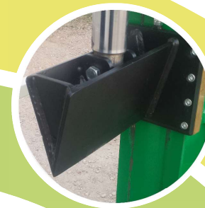
CUNEO 300 L