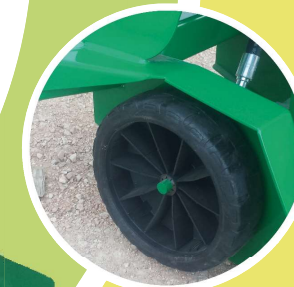
RUOTA DIAMETRO 240