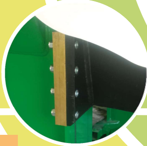
LARDONI IN OTTONE