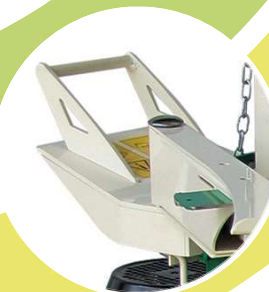
MANIGLIONE RINFORZATO PER UNA PRESA SICURA